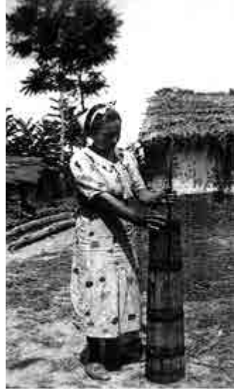
Ντουρβανίζει το γάλα για να βγάλει το βούτυρο (Κ.Μ.Σ.)