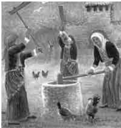
Κοπανίζουν για να αποφλοιώσουν το σιτάρι.