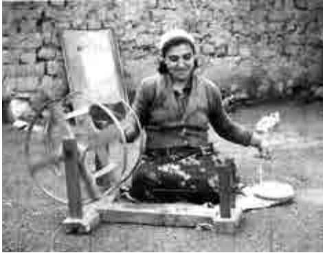
Πάνω: Τσικρίνι (Ροδάνι) (Κ.Μ.Σ.)