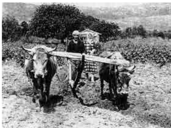
Όργωμα με βόδια στα Παράκοιλα (Κώστας και Αμερσουδά Βαλλίνα, 1962).